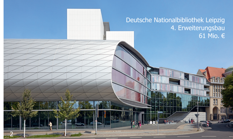
Deutsche Nationalbibliothek Leipzig 4. Erweiterungsbau 61 Mio. €