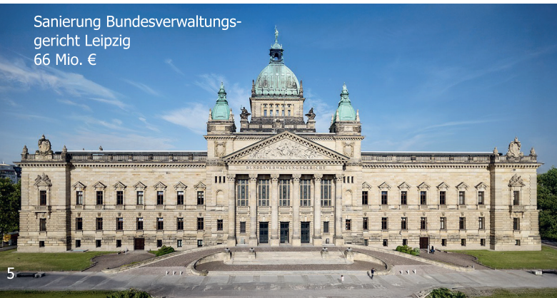
Sanierung Bundesverwaltungsgericht Leipzig 66 Mio. €

Die zivilen Bundesbaumaßnahmen im Freistaat Sachsen reichen von modernen Forschungs- und Laborbauten des Umweltbundesamtes über die Ortsverbandsgebäude für das Technische Hilfswerk bis hin zu zukunftsweisenden Verwaltungsgebäuden der Bundespolizei.