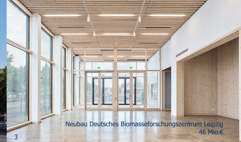
Neubau Deutsches Biomasseforschungszentrum Leipzig 46 Mio. €