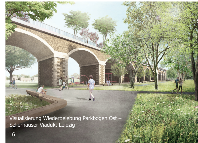
Visualisierung Wiederbelebung Parkbogen Ost – Sellerhäuser Viadukt Leipzig