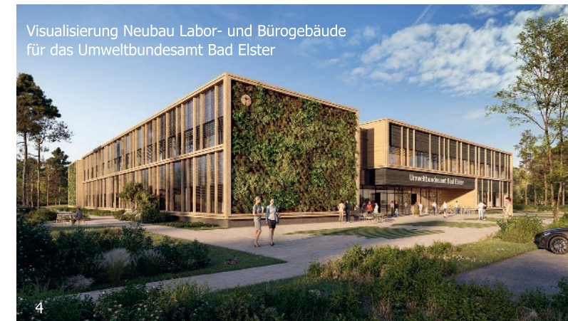
Visualisierung Neubau Labor- und Bürogebäude für das Umweltbundesamt Bad Elster

Der Bundesbau in Sachsen zeichnet sich durch eine enge Verzahnung von strategischer Fachaufsicht und operativer Ausführung aus. Dabei werden sowohl historische als auch moderne Anforderungen berücksichtigt, um den vielfältigen Aufgaben gerecht zu werden und die Infrastruktur für den Bund zukunftsfähig zu gestalten.